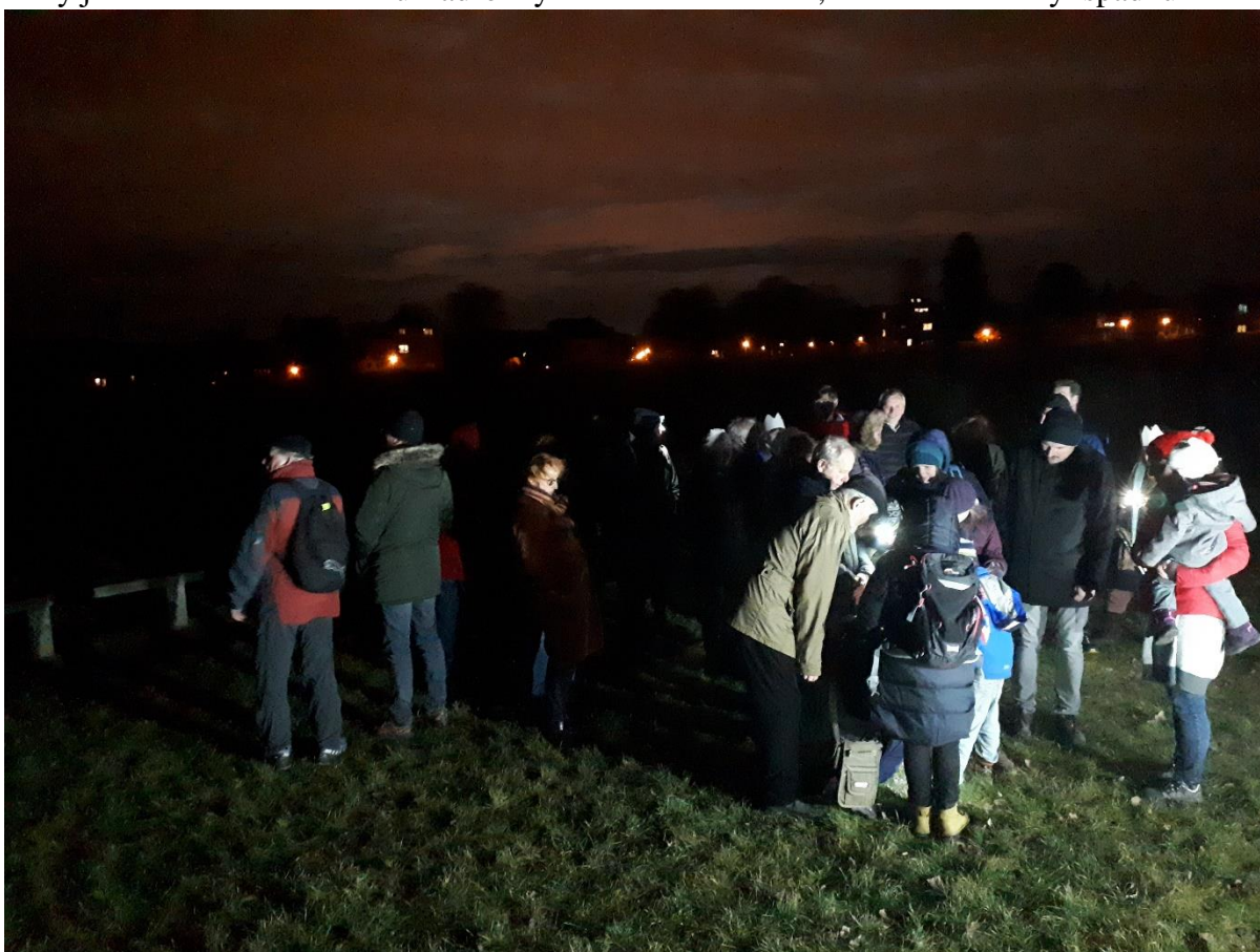
Bitva se obzvláště líbila nejmladším žoldněrům